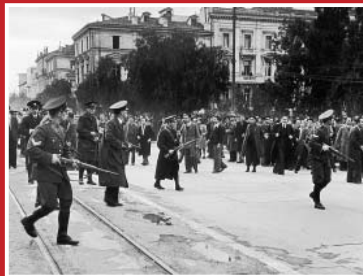
Δεκέμβρης 1944. Η Αστυνομία ετοιμάζεται να χτυπήσει συγκέντρωση του ΕΑΜ στην πρόσφατα απελευθερωμένη Αθήνα. Αποτέλεσμα, η Συνθήκη της Βάρκιζας και ο αφοπλισμός του ΕΛΑΣ. Οι γενικευμένες διώξεις αριστερών που θα ακολουθήσουν σηματοδοτούν τον Εμφύλιο Πόλεμο του 1946-1949

Ζήτημα προς διερεύνηση αποτελεί η συμπεριφορά των απλών ανθρώπων, που βέβαια δεν λειτουργούν ως μονολιθικό μπλοκ. Ένα ερώτημα είναι και το πώς το ΕΑΜ αναδείχθηκε σε ηγεμονική δύναμη στην κατεχόμενη Ελλάδα. Σίγουρα, πάντως, το γεγονός ότι εκατοντάδες χιλιάδες άνδρες και γυναίκες συμμετέχουν στις ΕΑΜικές οργανώσεις, κατεβαίνουν σε συλλαλητήρια και ψηφίζουν στις εκλογές της ΠΕΕΑ, δεν αποδεικνύει από μόνο του τίποτε, αν λάβει κάποιος υπόψη τις ελάχιστες επιλογές που είχαν οι άνθρωποι αυτοί. Προφανώς κάποιοι ταύτιστηκαν ιδεολογικά με το ΕΑΜ, αλλά όπως δείχνουν πολλές πρόσφατες τοπικές έρευνες, άλλοι εξαναγκάστηκαν να το υποστηρίξουν ή λειτούργησαν καιροσκοπικά. Πού, πόσοι, τότε και σε ποιο βαθμό παραμένουν θέματα προς διερεύνηση και απαιτούν την απομάκρυνση από σαηνευτικές βεβαιότητες, που όμως δεν αντιστοιχούν στην πραγματικότητα. Συμπερασματικά, τα πραγματολογικά στοιχεία δεν μπορεί να θεωρηθούν αμελητέα – ή άχρηστα – επειδή οι υπάρχουσες ερμηνείες κινούνται, δήθεν, σε ένα ανώτερο και πιο αφηρημένο επίπεδο, ασχολούνται με τη «μεγάλη ιστορία» και παραβλέπουν τα εμπειρικά στοιχεία ως «λεπτομέρειες».