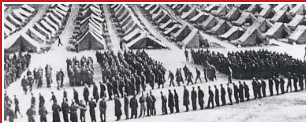
Μακρόνησος 1949. Το στρατόπεδο «φιλοξένησε» και προσπάθησε να αναμορφώσει με τη βία το φρόνημα χιλιάδων στρατιωτών και πολιτών από το 1947 ως τα τέλη της δεκαετίας του '50, αποτελώντας ένα από τα χαρακτηριστικά του μετεμφυλιακού κράτους

Τελικά, στο θέμα της μεθοδολογίας υπάρχουν, όπως είναι φυσικό, διαφορετικές εκδοχές και προτιμήσεις. Ας μην ξεχνάμε, όμως, πως κεντρικό κριτήριο εγκυρότητας αποτελούν οι δημοσιεύσεις σε επιστημονικά περιοδικά και εκδοτικούς οίκους όπου ισχύουν αυστηροί κανόνες επιλογής. Και από την άποψη αυτή, άλλοι υστερούν και όχι εμείς.